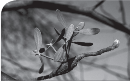
Mistelpräparate: Kassen müssen Kosten übernehmen