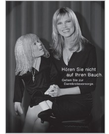
Darmkrebs: Vorsorge auf dem Prüfstand