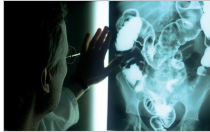
Statistik: die häufigsten Klinikdiagnosen im Überblick